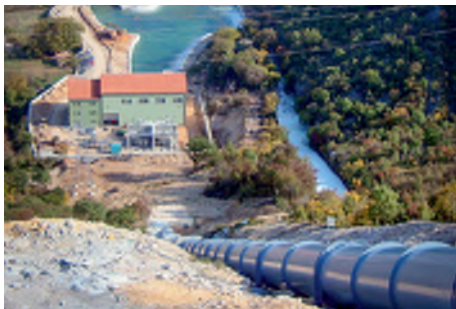
HE Mostarsko Blato