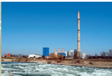
KKE TE-TO Zagreb - Blok K 208 MW e / 140 MW t KKE TE-TO Zagreb - Blok L 100 MW e / 80 MW t