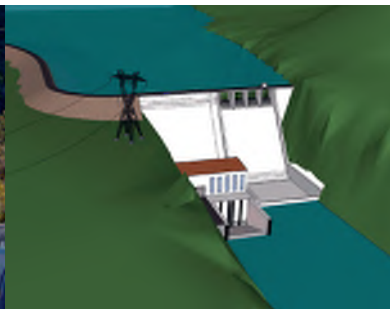
HE Argun Čečenija, hidroenergetsko korištenje sliva rijeke Argun