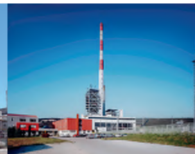
TE Plomin 1 i 2 125 MW i 210 MW