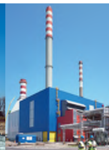
KKE Sisak - Blok C 250 MW e / 50 MW t