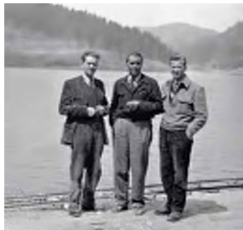
Izgradnja HE Vinodol

Rezultati rada stručnjaka Elektroprojekta čine jedinstvenu arhivu koja sadrži preko 23.000 knjiga projekata izrađenih u Elektroprojektu, među kojima se nalaze projekti većine hidroelektrana i termoelektrana te raznih drugih objekata izgrađenih u Republici Hrvatskoj. Područja djelatnosti koje su bila predmetom rada Elektroprojekta od njegovog osnutka do danas održavana su tijekom cijelog razdoblja postojanja te proširivana u skladu s prilikama i potrebama gospodarskog razvoja i zahtjevima na tržištu. Tako je, uz zaštitu voda, okoliša i prirode, predmet djelatnosti proširen i na korištenje poticanih obnovljivih izvora energije kao što su vjetar, sunce, biomasa i geotermalna energija, te i na infrastrukturne projekte kao što su tramvajska pruga i žičare.