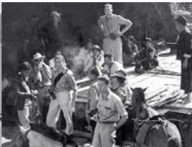
Elektroprojekt u Burmi