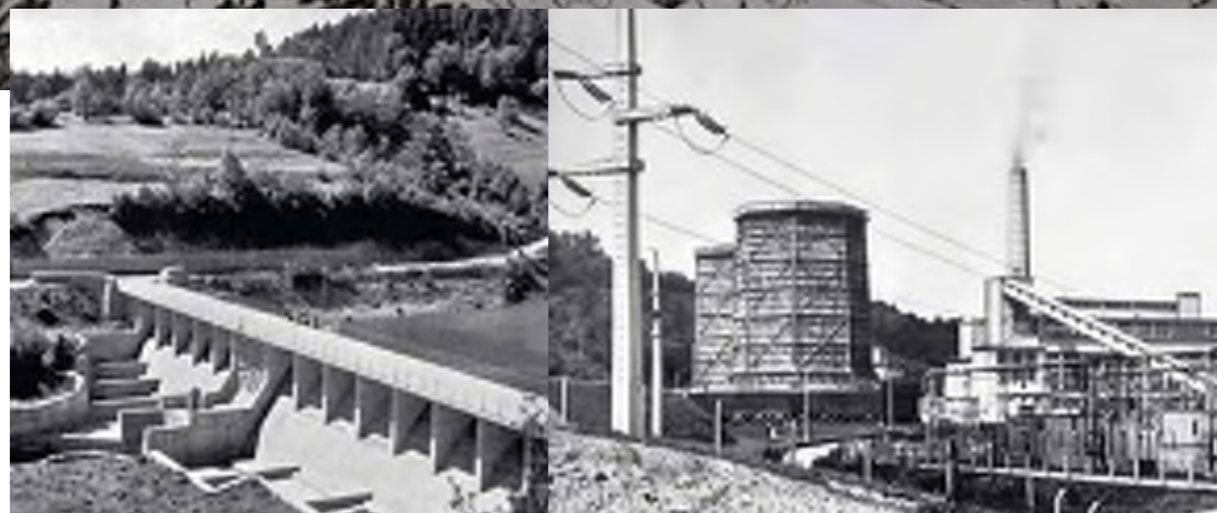
HE Vinodol – brana Bajer

Vlada FNRJ osniva 12.III.1949. poduzeće za projektiranje hidroelektrana i istražne radove, pod imenom Hidroelektroprojekt s filijalama u glavnim gradovima svih republika, osim Crne Gore. Projektantska grupa za hidroelektrane 1.XI.1949. prelazi iz IPZ-a u Hidroelektroprojekt - Zagreb gdje ima poslovnu zadaću obavljati projektiranje hidroelektrana i tehnički nadzor na teritoriju NR Hrvatske. Na taj dan dolazi do stvarnoga osamostaljenja novoga poduzeća, iako je prvi namještenik upisan u matičnu knjigu Hidroelektroprojekta već 1.IV.1949. i počeo raditi u njemu. Usvajajući sve te činjenice, 1.IV.1949. smatra danom osnivanja Elektroprojekta.